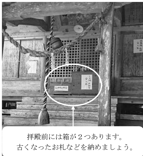
拝殿前には箱が2つあります。 古くなったお札などを納めましょう。

防団8の2との合意 のもと、同様な形態 として防災組織図が 出来上がっておりま すが、災害弱者や要 援護者の再確認(民 生委員と一緒に )、防災のための